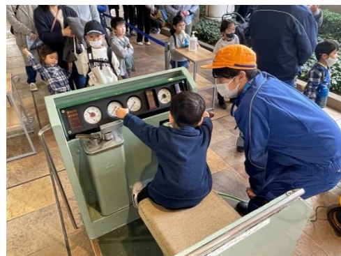
昨年の体験の様子

当社では、2021年11月に「子育て応援ポリシー」を策定、あわせて小児IC運賃の全区間一律50円化（低廉化）など、鉄道会社ならではの取り組みを推進しています。このポリシーに賛同いただき本イベントに協力いただく自治体・企業さまは昨年より10増えて44となるなど、着実に子育て応援の輪が広がっていると考えており、今後とも「日本一子育てしやすい沿線」を目指して取り組みを加速させます。