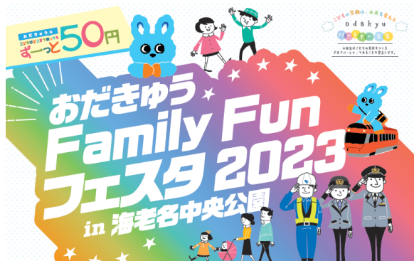
イベントポスターの一部

また、戦国時代に小田原を拠点とした「風魔忍者」によるアクロバティックなショーや、手裏剣・吹き矢による的当てゲームをはじめ、本企画に賛同いただくパートナーによる沿線地域の歴史や文化自体をお楽しみいただけるコンテンツもご用意します。さらに、小さなころから社会課題に触れていただきたい思いから、海洋プラスチックで作るストラップや、廃棄予定のダンボールでクリスマスオーナメントを作るワークショップをご用意しているほか、サンリオの「ハローキティ」に加え、当社の子育て応援担当「もころん」など合計15のキャラクター登場で、イベントを盛り上げます。