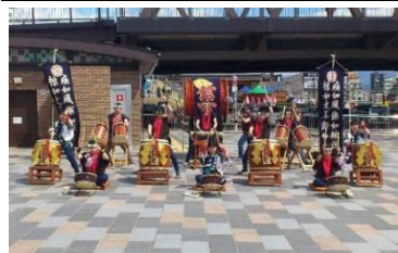
【甲斐和太鼓衆信玄太鼓保存会】