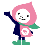
【JRの山梨キャラクター モモずきん】