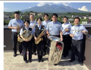
【JR東日本甲府エリア音楽隊】