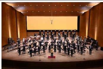
【甲斐市敷島吹奏楽団】