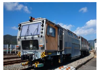
マルチプルタイタンパー