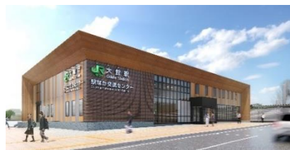
大館新駅舎 外観イメージ