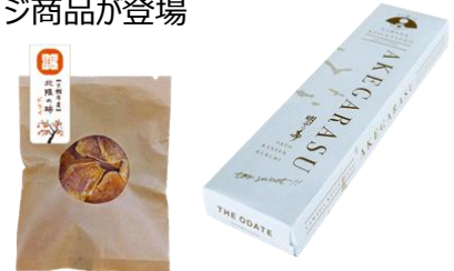
北限の柿ドライ (畑がない農家)