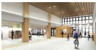
大館新駅舎 駅舎内イメージ