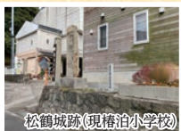
松鶴城跡(現椿泊小学校)