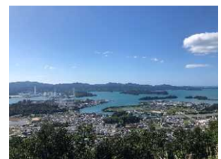
椿泊・橋湾の景観