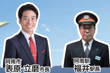
阿南市 表原 立磨市長

四国最東端に位置する阿南市は、海・山・川の自然に恵まれ、若杉山遺跡や阿波水軍などの由緒ある史跡と四国遍路のお接待文化が息づく一方で、LEDの世界的シェアを誇る地場企業があるなど、豊かな自然と文化、産業が鮮やかに調和したまちです。