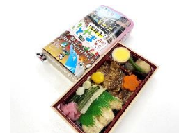
常陸牛さとやま満喫弁当

※A.C.D.E コースには、常陸牛さとやま満喫弁当（昼食）がつきます。 お弁当は往路の列車にて配布します。