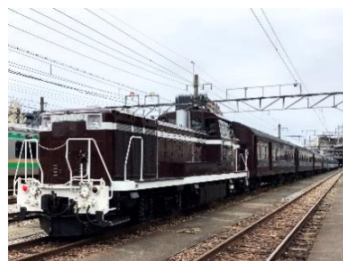
DE10形ディーゼル機関車+旧型客車