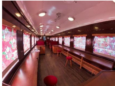
旧型客車(ラウンジカー車内)