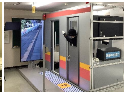
車掌シミュレータ