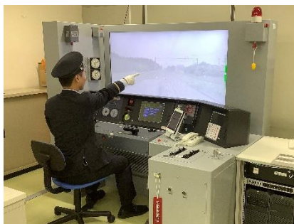
運転シミュレータ