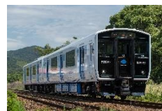
BEC819 系架線式蓄電池電車 (JR 九州)