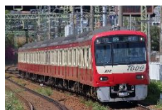
1000 形電車 (京急電鉄)