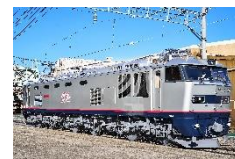
EF510 形式電気機関車 (JR 貨物)