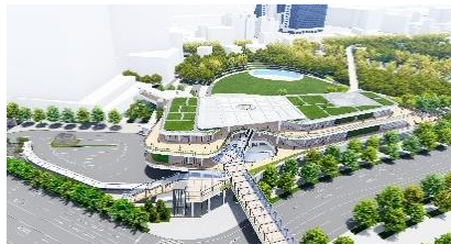
電力の 100%再エネ化や省エネルギーの地域冷暖房を活用した 「大阪駅 (うめきたエリア)」 (2025 年春全面開業予定) (JR 西日本)