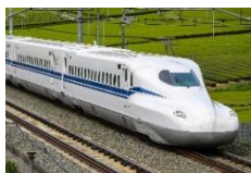
N700S 新幹線電車 (JR 東海、JR 西日本、JR 九州)