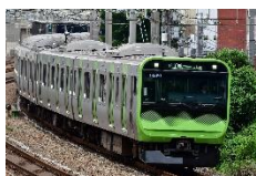
E235 系電車 (JR 東日本)