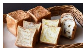
POP UP CASTLE