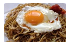
進藤冷菓「ババヘア・男鹿しょつる焼きそば」 「炭焼きホルモン ぴよん吉」 石谷製麺工場「横手やきそば」