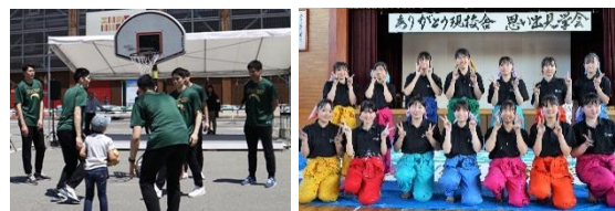
「フリースロー体験」