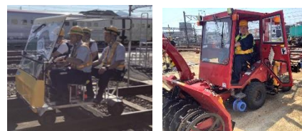
「レールスクーター乗車体験」