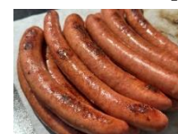
大仙市観光物産協会 「ソーセージ」