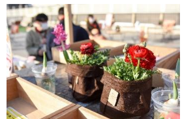
【寄せ植えワークショップ(イメージ)】