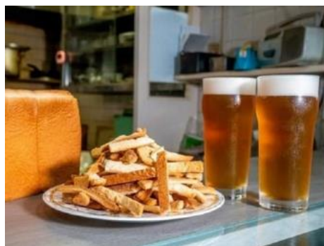
【クラフトビール(イメージ)】