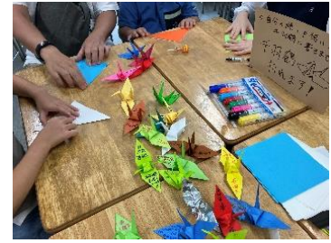
【イベントイメージ】