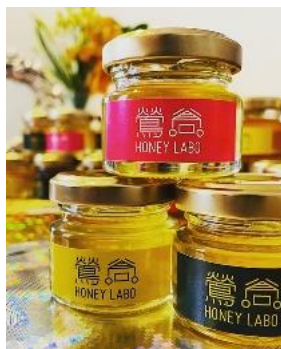
【ハチミツ(イメージ)】