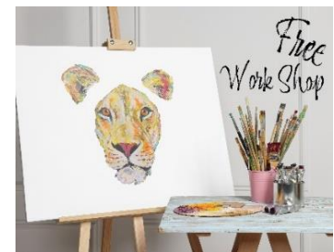
【フリーワークショップ(イメージ)】