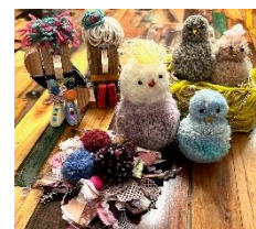
【アップサイクルワークショップ】