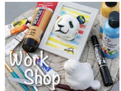
【ワークショップ(イメージ)】