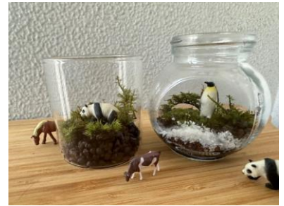
【ワークショップ(イメージ)】

https://helloaini.com/travels/45790?prcd=rdX6