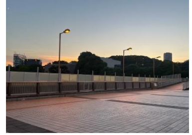
【夕刻のパンダ橋(イメージ)】