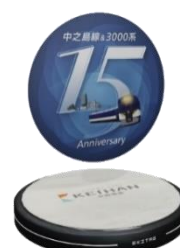
〈京阪電車オリジナル NFT コンテンツ〉