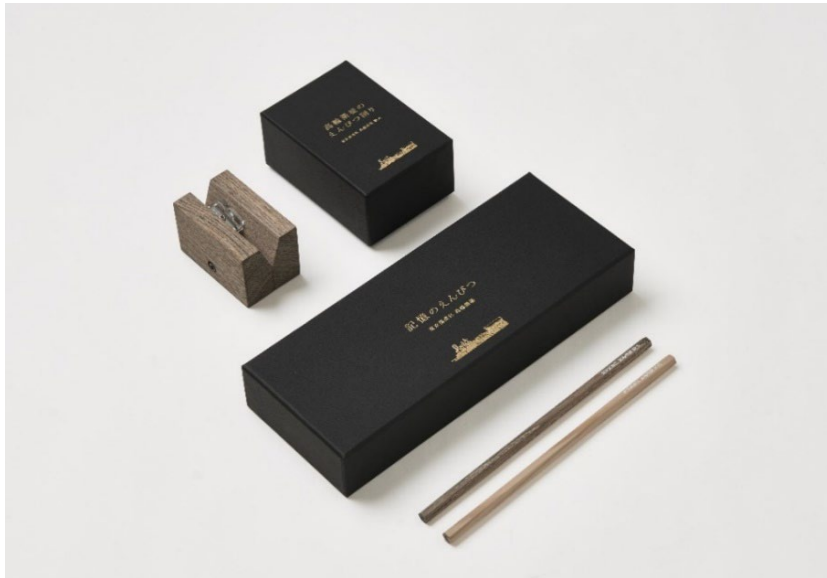
「記憶のえんぴつ」パッケージデザインイメージ

販売は応援販売サービス「マクアケ ※1 」にて、10月13日（金）から限定で予約販売を開始します。 ※1 プロジェクト実行者が開発背景などのストーリーとともに発表する新商品や新サービスを、サポーターが応援の気持ちを込めて先行購入することができるサービス