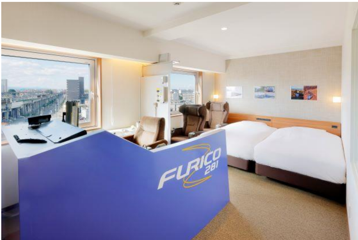
『キハ281 トレインルーム』

多くの鉄道ファンに親しまれた同車両の魅力を体感いただけるJRイン千歳初のコンセプトルーム『キハ281 トレインルーム』をぜひご利用ください。