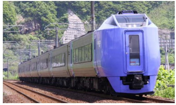
キハ 281 系車両

1994 年 3 月のデビューから、2022 年 10 月 23 日のラストランまで、28 年にわたり、「スーパー北斗」・「北斗」として札幌～函館間を走行し、気動車として当時日本一の速さを誇りました。