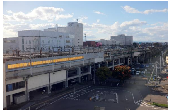
客室の窓から見える千歳線