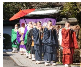
薬王院お練りの様子（イメージ）