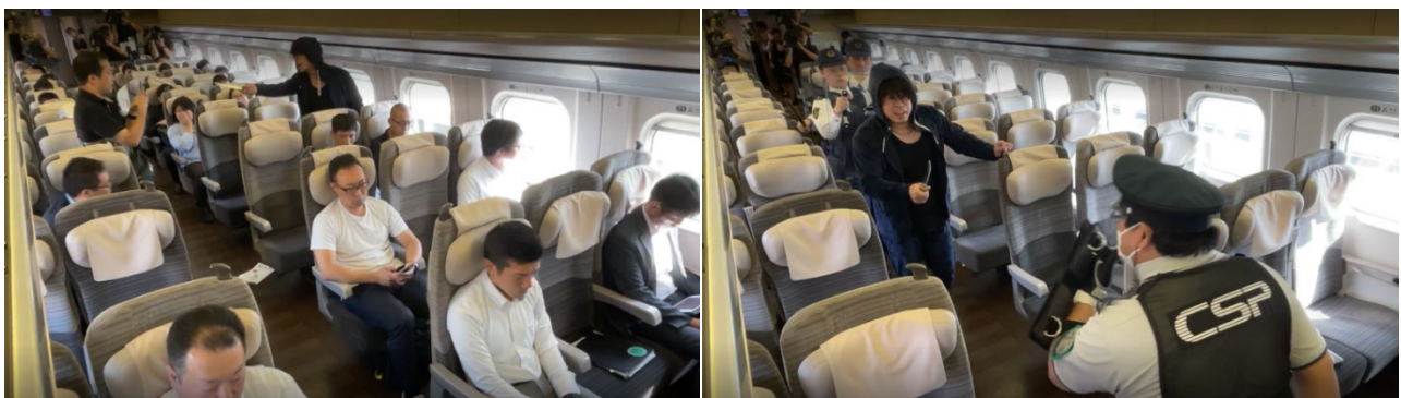
10月3日 東北新幹線（宇都宮～小山間） 異常時対応訓練

乗務員、駅、指令、アテンダントなどの JR 東日本グループ社員に加え、警察や警備会社の協力を頂きながら、新幹線などの実車両を用いた異常時対応訓練を定期的実施しています。警察と連携した実践的な内容とすることで、課題の抽出および社員一人ひとりの異常時対応能力の向上を図っています。また、全ての乗務員に対して、異常時の対応フローを教育しています。