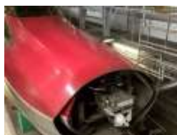
ボンネット開閉操作