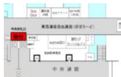
秋田駅内 受付場所(イメージ)