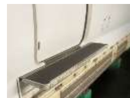
ドアステップ開閉操作