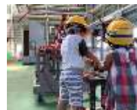
実物大教育用機材体験