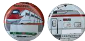
缶バッジデザイン