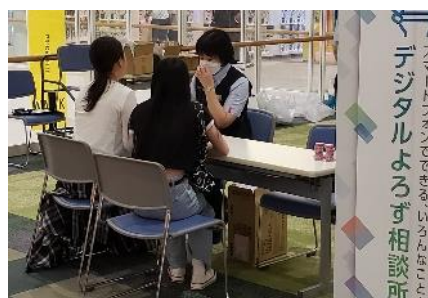
デジタルよろず相談所

※荒天時や災害時など、当日の運行状況によってはイベントを予告なく中止する場合や内容を変更する場合があります。