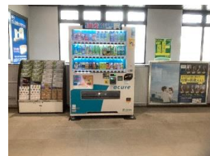
改札内クイズ設置箇所