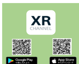
ARアプリ XR CHANNEL