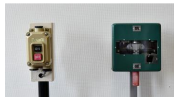
発車ベル・ドアスイッチ