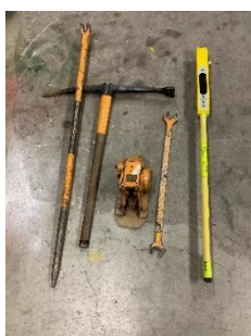
メンテナンス道具

メンテナンス部門の社員が業務で使う道具の紹介や使用体験、警戒警備等で使用するATカート（AT車）の展示、YouTubeのJR東日本公式サイトにて放映されている「and E」の鉄道クレーンとレール探傷車の動画を放映し、メンテナンス部門の社員が説明します。