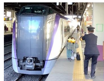
特急かいじ号写真撮影