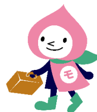
JRの山梨キャラクター「モモずきん」