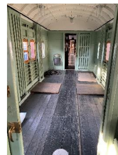
オハニ 36 荷物室内