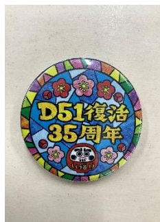
缶バッジ作成体験