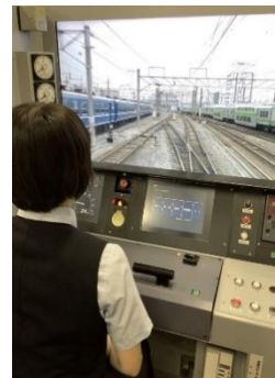
運転シミュレータ体験