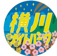
「SL 横川ナイトパーク」 ヘッドマーク