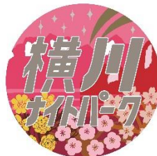
「EL 横川ナイトパーク」 ヘッドマーク