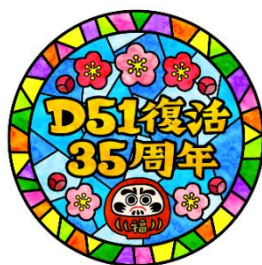
「D51 復活 35 周年」限定ヘッドマーク

11月3日(金)、4日(土)、5日(日)、18日(土)、19日(日)に運転する「D51 復活 35 周年」号に合わせ、35周年限定ヘッドマークを装着します。