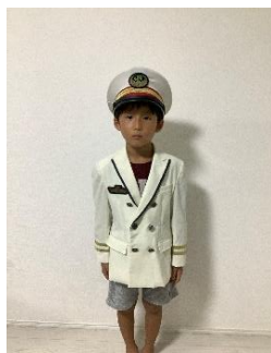
子ども制服着用体験