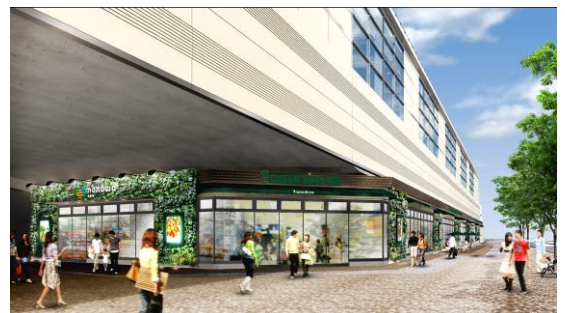
nonowa 武蔵境外観イメージ