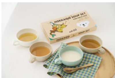
【北海道スープ4種セット】