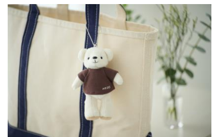
【マスコットベア・ドウ】