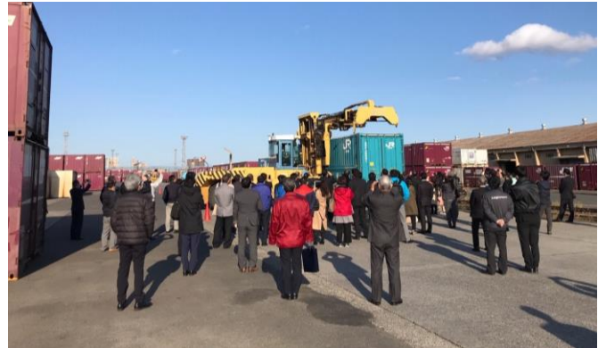
鉄道コンテナ見学会の様子(仙台貨物ターミナル駅)