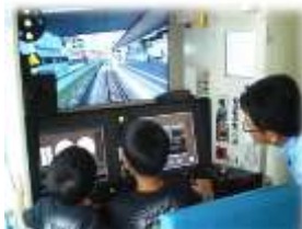
運転シミュレーター