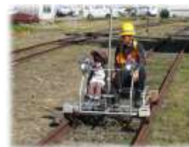
軌道自動車乗車体験