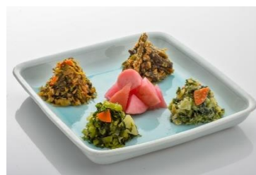
「漬物」 晩菊本舗 三奥屋

山形工房製の競技用認定けん玉「大空」をベースに、コラボでしか味わえないステイン塗装の「けん」と、夕暮れを思わせる鮮やかなカラーリングの「玉」にKENDAMA PLACEのロゴをあしらったデザインを採用しました。