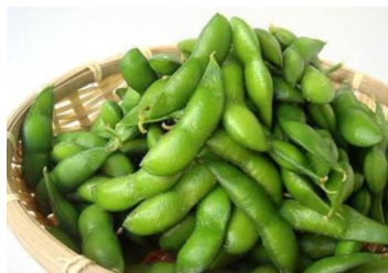
「だだちゃ豆」 (有)ティーズファクトリー

山形県鶴岡市特産のだだちゃ豆が直送で登場！芳醇な香りと濃厚な甘味が特徴のだだちゃ豆を是非ご堪能ください。当日はご家庭用にちょっとお買い得な規格外品の販売もごさいます。