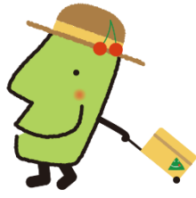
山形県観光 PR キャラクター 「きててろくん」