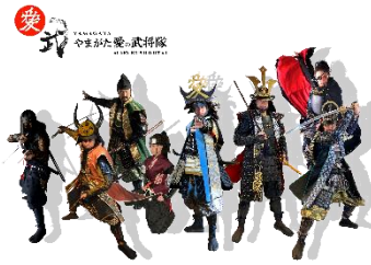
「やまがた愛の武将隊」