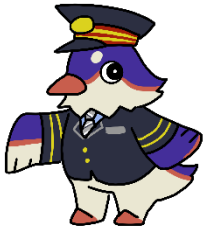
JR 東日本山形エリア マスコットキャラクター 「つどりい」