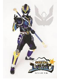
「未来創造戦士 ユメリオン」