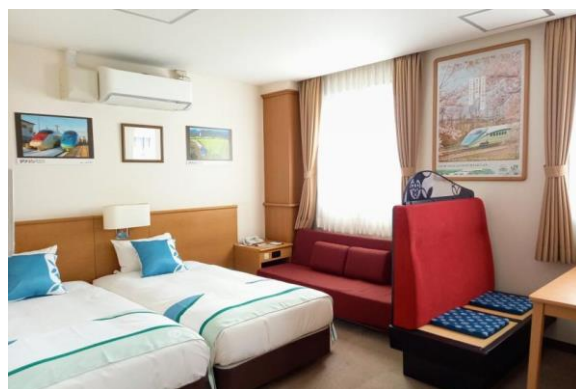
「とれいゆ つばさ」コンセプトルーム内観