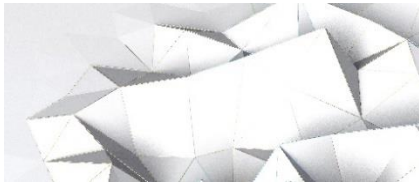
【折り紙の世界 イメージ】

日本の伝統的な遊びの 1 つである「折り紙」。現在、折り紙の技法は、遊びとして楽しむだけにとどまらず、建築やファッション、医療等、様々な分野で応用されています。そんな折り紙の可能性にふれる、みらい折り紙ワークショップを開催します。鶴や風船だけではない、みらい折り紙の世界を一緒に楽しみましょう。