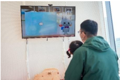
【アバター保育園 イメージ】

アバター先生がお子さま向けに絵本の読み聞かせ、クイズなどを実施する未来型保育園をトライアル実施します。アバターと共生することで人材不足の解消や保育士の業務負担軽減など保育業界の課題解決につながる可能性を秘めたイベントです。アバターと人間の共生もそう遠い未来ではありません。ぜひ、未来の保育園をご体験ください。