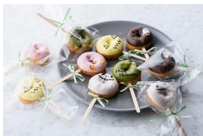
【ウフドーナチュ イメージ】

“ママが子どもに食べさせたい手作りのおやつ”というコンセプトから生まれた金沢発のブランド・ウフドーナチュ。ハロウィン限定の特別なデザインでお届けします。 ※単品での販売となります。