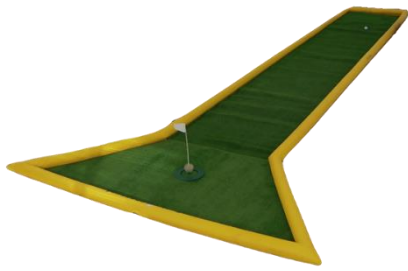
【パターゴルフ イメージ】

お子さまから大人までお楽しみいただけるパターゴルフを開催します。ご参加いただいた方全員に周遊スタンプラリーのスタンプを1個押印します。見事ホールインされた方には景品として「品川駅限定 オリジナル電車カード」をプレゼントします。高輪ゲートウェイ駅から JR 品川駅までのおよそ 984 ヤードの距離感を、パターゴルフを通してご体感いただけます。その他、TAKANAWA GATEWAY CITY の紹介コーナーなど、注目コンテンツが揃います。