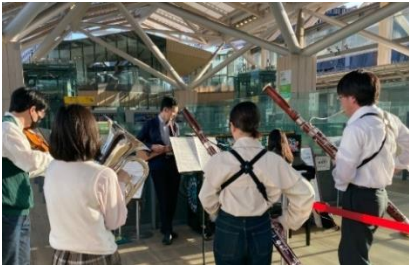
【Music Space イメージ】

音楽を共に奏でることを通して、地域の皆さまとの交流を深め、将来の TAKANAWA GATEWAY CITY やその周辺のエリアが、音楽で満ち溢れる街になることを目指して始まった実験の場「Music Space」。ここでは、自由に楽器を持ち込み、Station Piano と共にアンサンブルをお楽しみいただけます。