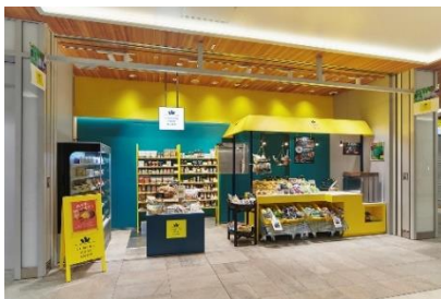
【LUMINE AGRI SHOP イメージ】

TAKANAWA GATEWAY CITY において商業エリアの運営を行う株式会社ルミネは、都会と畑を結びながら、食の出会いと学びの機会をつくっていく農業プロジェクト「LUMINE AGRI PROJECT(ルミネアグリプロジェクト)」より、JR 新宿駅 ニュウマン新宿 2F エキナカの直営店「LUMINE AGRI SHOP(ルミネアグリショップ)」を出展。