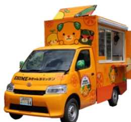
【愛媛みきゃんずキッチン 出展イメージ】

愛媛みきゃんずキッチン、煮込屋 赤ねこ、ROCKET CHICKEN、FOODTRUCK HAGARI、フレックルキッチン