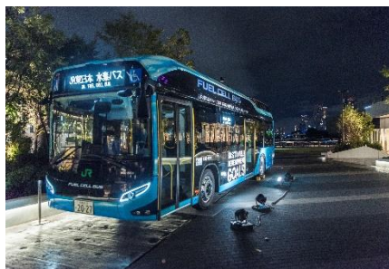
【燃料電池バス イメージ】

本イベントの開催に合わせ、高輪ゲートウェイ駅～ウォーターズ竹芝間を当日限定で運行します。(JR 東日本グループは 2050 年度の CO 2 排出量「実質ゼロ」を目指す取組みの一環として、東京駅～浜松町駅周辺エリアを循環する燃料電池バスを運行しています。)