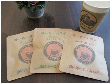
【あいはーと・みなと 提供商品イメージ】

高輪エリアの近隣町会・自治会を中心に、地域の方にぴったりなお楽しみコンテンツが盛りだくさんです。飲食店のテイクアウトメニューやお子さま向けゲームコンテンツなど、高輪エリアの「手作り感」をお楽しみください。