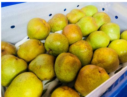
【長澤農園 出展商品イメージ】

芝浦のプラタナス公園で定期的に行われている「全国連携マルシェ」が特別出展します。港区と連携関係にある自治体等による全国の旬なものや人気の品物が勢揃いします。普段手に入らない地域の特産品を、ぜひお手に取ってご覧ください。