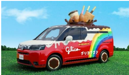
【グリコワゴン イメージ】

港区に事業所などがある企業・官公庁による PR コンテンツが揃います。お子さまに人気の消防車やパトカーが登場するほか、江崎グリコの「グリコワゴン」が高輪エリアに初登場。さらに、JR 東日本が街のグリーン利活用に向けて取り組む「TAKANAWA HOP WAY」(高輪エリアでホップを育てる地域コミュニティ活動)では、高輪ホップを使用したオリジナルビールを限定販売します。「地産地消」の希少なクラフトビールを、ぜひお楽しみください。