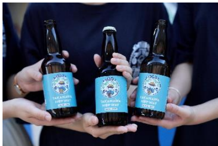
【TAKANAWA HOP WAY イメージ】

港区に事業所などがある企業・官公庁による PR コンテンツが揃います。お子さまに人気の消防車やパトカーが登場するほか、江崎グリコの「グリコワゴン」が高輪エリアに初登場。さらに、JR 東日本が街のグリーン利活用に向けて取り組む「TAKANAWA HOP WAY」(高輪エリアでホップを育てる地域コミュニティ活動)では、高輪ホップを使用したオリジナルビールを限定販売します。「地産地消」の希少なクラフトビールを、ぜひお楽しみください。