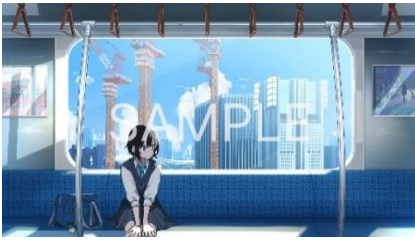
【展示アート イメージ】

KDDI 株式会社、株式会社 foriio との共同アートプロジェクト「高輪 VISIONS」にて、10 名のクリエイターがそれぞれの感性で描いた「今の高輪」のアートを高輪ゲートウェイ駅 改札外に展示します。この機会にお気に入りの一枚を見つけてみてはいかがでしょうか。