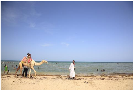
【エリトリア イメージ】

港区内の大使館が出展します。各国の文化や観光、特産品のPRを通じて、訪れた皆さまに高輪から各国の魅力を発信します。