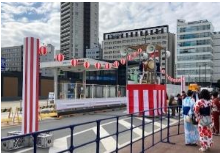
【盆踊り大会 イメージ】