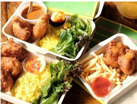
【ROCKET CHICKEN 提供商品 イメージ】

イタリア料理や煮込み料理、蛇口から出てくるみかんジュースなど、高輪エリアの内外で出会える様々な美味しさを堪能いただけるキッチンカーブースをご用意しました。秋空の下でステージや盆踊りを鑑賞しながら、飲食をお楽しみください。