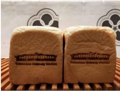
【高輪ゲートウェイ駅限定 焼印入本食パン イメージ】

2024 年度末の TAKANAWA GATEWAY CITY のまちびらきに向けたマルシェを開催します。高輪ゲートウェイ駅オリジナル焼印入り商品の限定販売を行うほか、季節の焼き芋などを販売します。