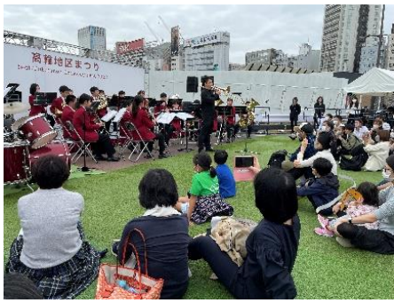
【ステージイベント イメージ】

高輪エリアの学生や音楽の団体、人気のご当地キャラクターなどによるステージイベントを開催します。会場では、芝生の広場でどなたでもゆったりと鑑賞いただけます。