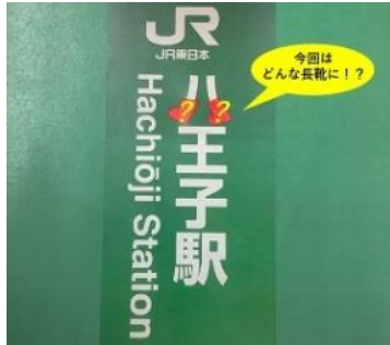
「シーズンサプライズ」

期間限定のデザインを見つけて、ハッシュタグ「シーズンサプライズ」でシェアしてください！