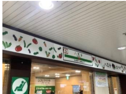
過去の装飾の様子