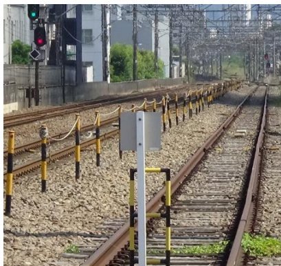
北府中駅構内 折返線