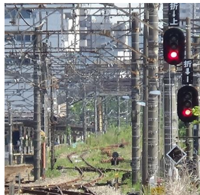
北府中駅構内 1番線