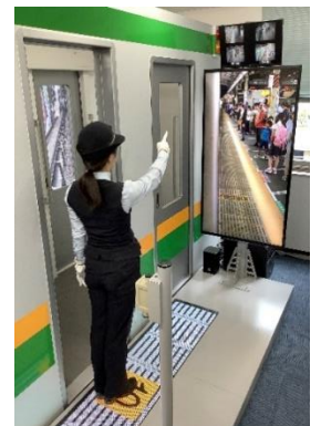
【シミュレータ体験】