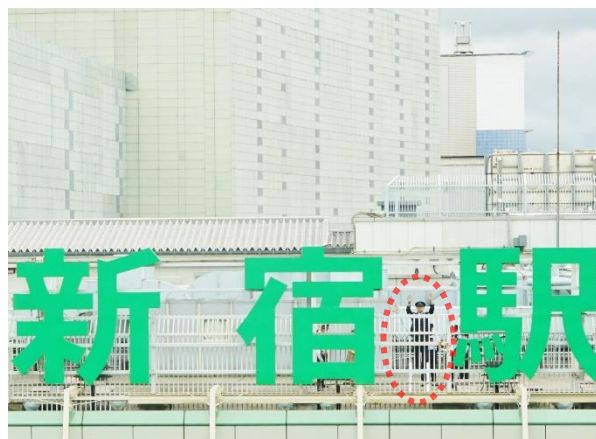
【JR 東日本新宿駅名看板との撮影】