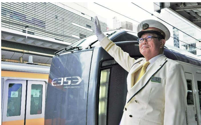
【駅長体験・出発式イメージ】