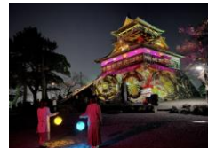
丸岡城プロジェクトマッピングナイト「ヒカリ結び」