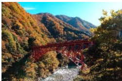
黒部峡谷トロッコ電車(新山彦橋)