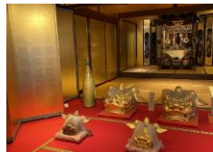
加賀伝統工芸村 ゆのくにの森「黄金の間」