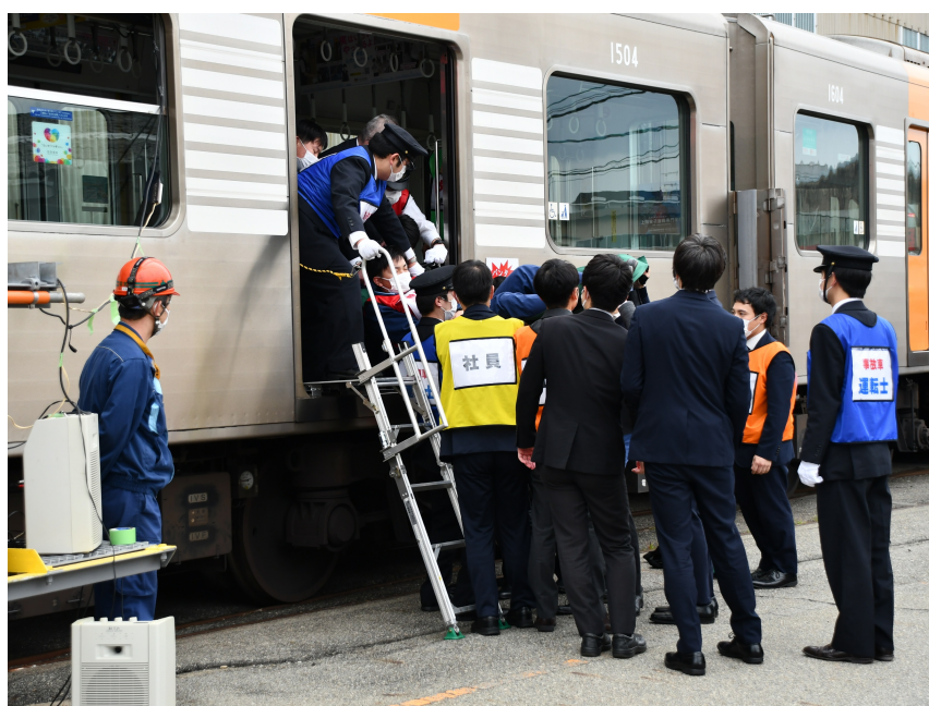
「列車事故総合対応訓練」 2022年11月22日（尼崎車庫にて）