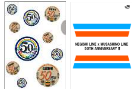
クリアファイルバッグ