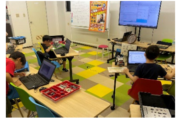
▲「プログラボ」授業の様子

※1 STEAM（スティーム）教育とは、科学（Science）・技術（Technology）・工学（Engineering）・アート（Art）・数学（Mathematics）の5つの領域を横断的に学ぶ教育です。