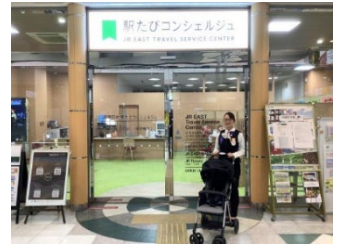
▲駅たびコンシェルジュでの貸出

ホテルや商業施設など、駅ナカからマチナカに設置箇所を拡大することにより、ちょっとした外出や、帰省や観光といった旅先、マチナカにおけるショッピングや趣味でのご利用などさまざまなシーンで子育て世代が子どもとより気軽に外出できる環境づくりを推進していきます。