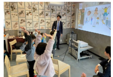
▲オンライン英会話プログラム

今後も駅を中心に複数の拠点で展開していきます。また、教育サポートについて英会話だけでなくアートや音楽など育成の幅を広げ、子どもの成長サポートを目指します。