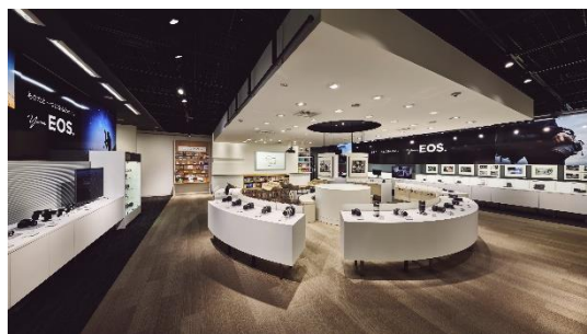
キヤノンフォトハウス銀座