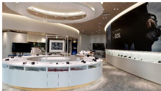
キヤノンフォトハウス大阪