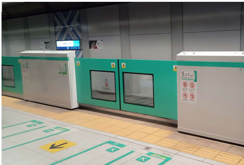
写真：導入イメージ（りんかい線ホームドア（東京テレポート駅））