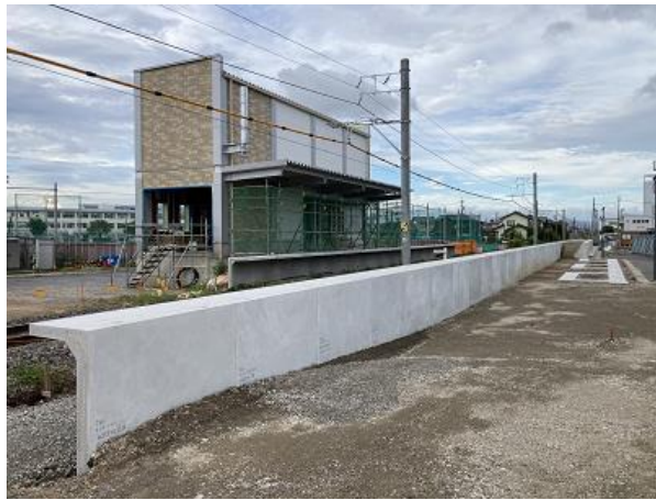
建設中の三河知立駅(移設後)