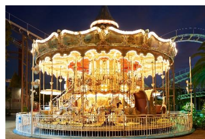
(左)ノームトレイン (中)ファンタジークルーズ (右)メリーゴーラウンド