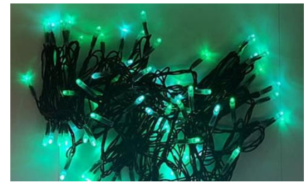
メーカーと開発したひらかたパークオリジナルのLED。繊細な表現が可能に。