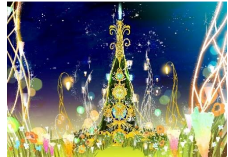
花や蝶の装飾が施されたエレガントなツリー

高さ約13mの巨大ツリー「花と妖精のツリー(仮称)」が誕生します。昨年から一新、夜に咲き誇るきらびやかな「花」を象徴としたデザインのツリーへ。昼に見ても夜に見ても美しい花のツリーを製作します。周辺にはサブツリーや光の花のイルミネーション、生花を装飾します。