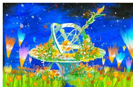
花の力強さ、生命力を表した「花の羅針盤」