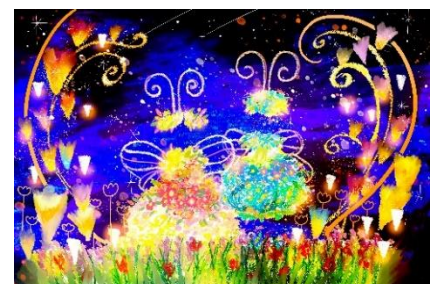
花の妖精になれる顔出しフォトスポット