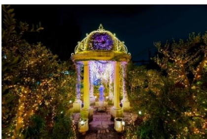
クラシックライトガーデン「愛の神殿」