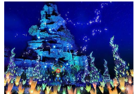
花占いができるマジカルラグーンステージ

花の装飾は、ひらかたパークのガーデニングチームがプロデュースをします。「イルミネーション」と「花」のプロフェッショナルの競演により、夜は美しさと見ごたえのあるイルミネーションとして、昼は花をメインとしたフォトスポットとしてお楽しみいただけます。ローズガーデンをイルミネーションで彩るエリア「クラシックライトガーデン」や光の花を用いたフォトスポットなどが登場します。