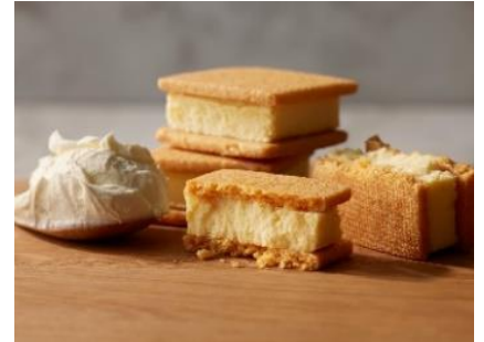
「チーズケーキサンド」