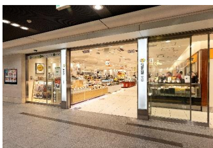
お弁当・惣菜エリア