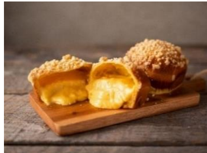
「御養卵のクリームパン」