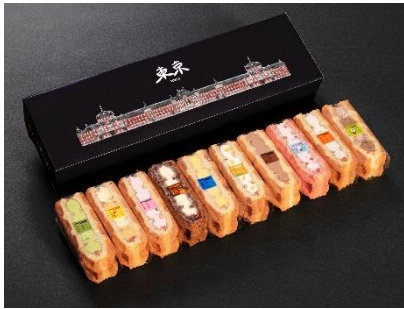
「東京駅限定ワッフルケーキ 10 個セット」