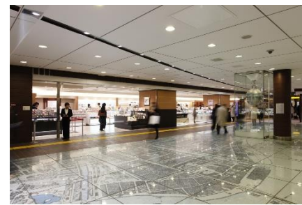
お土産・スイーツエリア