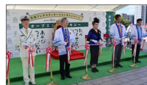
▲昨年のプレDCの様子(セレモニー)