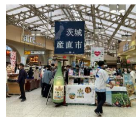
▲昨年の産直市の様子