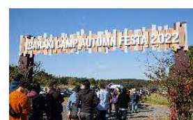
IBARAKI CAMP AUTUMN FESTA 2022の様子▲