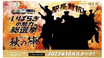
▲ティザービジュアル