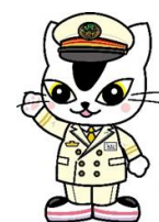
▲JR東日本水戸支社 E657系イメージキャラクタームコナくん