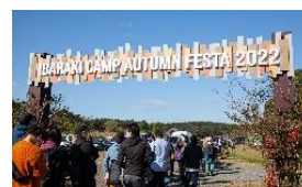
IBARAKI CAMP AUTUMN FESTA 2022の様子▲