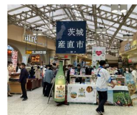
▲昨年の産直市の様子