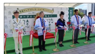
▲昨年のプレDCの様子(セレモニー)