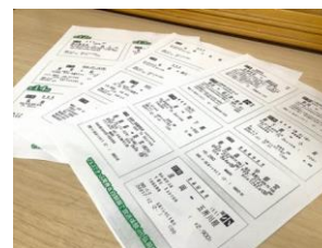
【発券したきっぷのコピー】