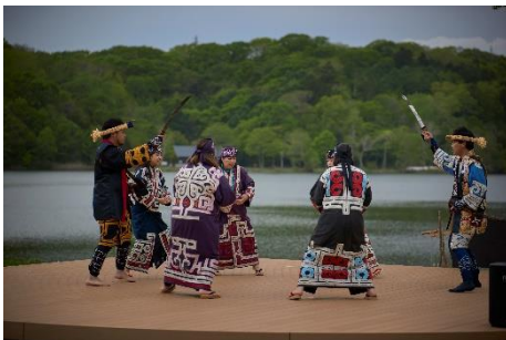
ウポポイ(民族共生象徴空間)

「TRAIN SUITE 四季島」の旅は、全て旅行会社が企画する旅行商品として販売します。旅行商品は、(株)JR 東日本びゅうツーリズム&セールスが販売するほか、主な旅行会社(海外の旅行会社を含む)での販売を予定しています。