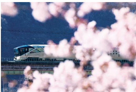
上越線・津久田-岩本 間