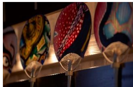
黒石ねぶたうちわ