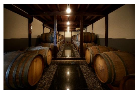
勝沼のワイナリー