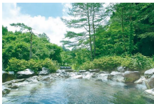
立ち寄りの湯 軽井沢千ヶ滝温泉