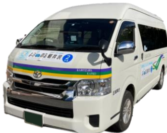
運行車両（通常タイプ）イメージ