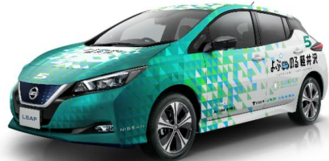
運行車両（電気自動車）イメージ