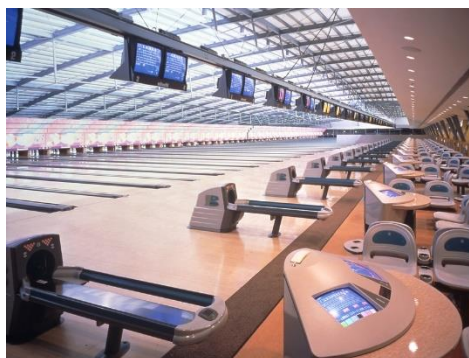
軽井沢プリンスボウル