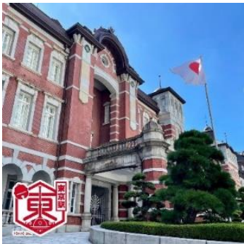
▲スタンプ活用機能例(東京駅)