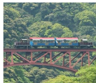
南阿蘇鉄道トロッコ列車 (イメージ)