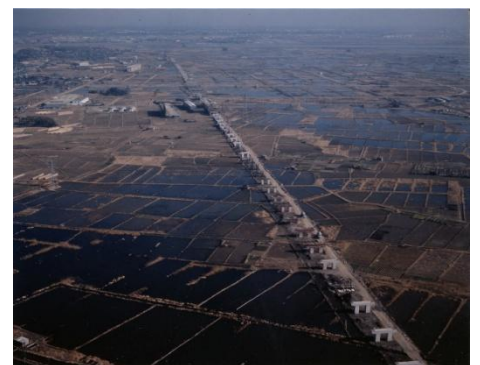
建設中の東西線浦安駅付近から行徳駅付近