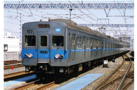
東西線が開業した昭和 39 年から平成 19 年まで活躍した 5000 系