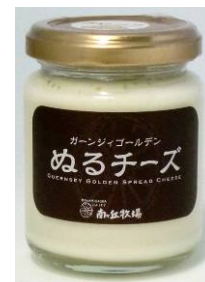
「ぬるチーズ」 ＜南ヶ丘牧場＞

ユニークなチューブタイプで使いやすいしかも清潔。ジャージー牛乳の濃厚ながらすっきりとした味わいをそのままヨーグルトにしました。