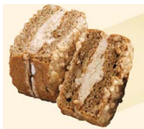
「大麦ダクワーズ」 ＜株式会社大麦工房ア＞

日本に約200頭あまりしか飼育されていない「ガンジー牛」からとれた生乳をふんだんに使用しました。パンはもちろんのこと、サラダなどにも合う一品です。