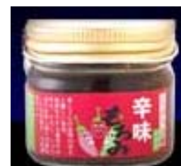
「天鷹 辛味もろみ」 ＜天鷹酒造株式会社＞

栃木県産の大豆・米、五島灘の塩を使い、本格的な天然醸造法により熟成した「上製天然味噌」を用いた、焼き餃子の味噌タレ。味噌の香りとコクが焼き餃子をさらに美味しくします。