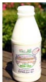
「飲むヨーグルト」 ＜那須興業株式会社＞

栃木県産の生乳を100%使用し、生クリームと蜂蜜を加えた濃厚な手づくりヨーグルトです。上品な味の本格デザートです。