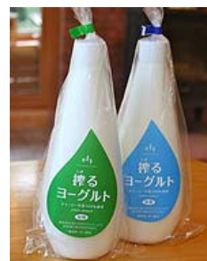
「搾るヨーグルト」 ＜森林ノ牧場＞

ジャージー牛からとれた生乳を100%使用し、酸味の少ない乳酸菌でじっくりと発酵させたマイルドな味わいです。