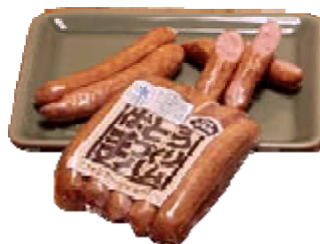
「茶色豚のウインナーソーセージ」 ＜有限会社星種農場＞

栃木県足利産の二条大麦を100%使用して焼き上げたやわらかく香ばしいお菓子。2010年にモンドセレクション金賞を受賞した商品です。