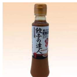
「餃子の達人」 ＜青源味噌株式会社＞

肉質の良いデュロック種の「茶色豚」を原料として、塩漬けから燻製、ポイルまでじっくりと手をかけてつくった一品です。ジュシーで上品な味わいをお楽しみください。