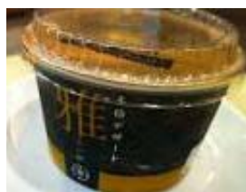
「ヨーグルト 雅」 ＜有限会社永島牛乳店＞

栃木県産の生乳を100%使用し、生クリームと蜂蜜を加えた濃厚な手づくりヨーグルトです。上品な味の本格デザートです。