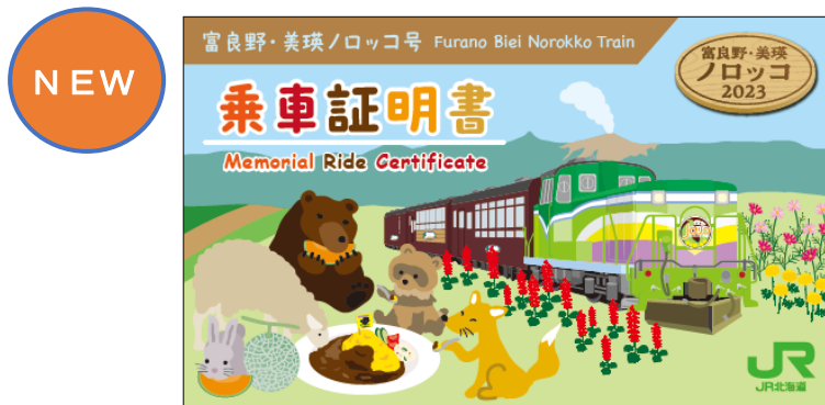
▲乗車証明書デザイン（8・9月 VER）

ご乗車いただいたみなさまへ「乗車証明書」をプレゼント！8月からは、デザインを変えてお配りしています。ぜひ季節ごとの乗車をお楽しみください。