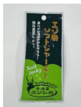
エゾ鹿ソフト ジャーキー (南富良野町)