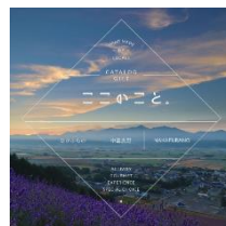
カタログギフト (中富良野町)