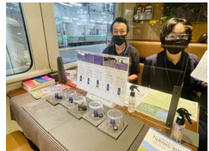
7月開催時の様子（イメージ）