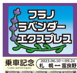
【イメージ】記念撮影用の手持ちボード

「ラベンダー」編成は、北海道と国の支援を受け、北海道高速鉄道開発株式会社が所有し、当社は無償貸与を受けております。支援に感謝を申し上げます。