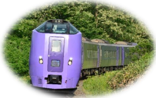
特急フラノラベンダーエクスプレス

秋ならではの花畑や田園風景が広がる富良野・美瑛へ、観光列車に乗ってお越しください。