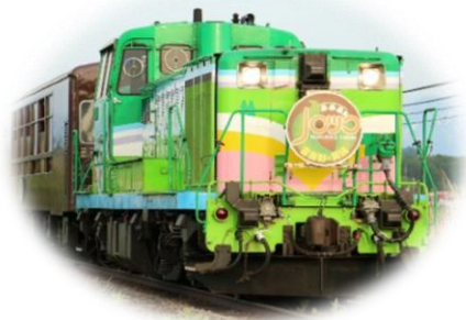
富良野・美瑛ノロッコ号