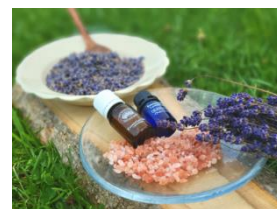
ラベンダーのバスソルト 作り体験 (中富良野町)