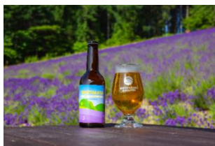
NAKAFURANO BREWERY クラフトビール (中富良野町)