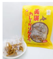
カレーかりんとう (美瑛町)