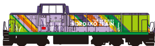
6・7月の運転：ラベンダー色のディーゼル機関車