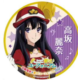
記念ヘッドマーク(イメージ) ※一部抜粋