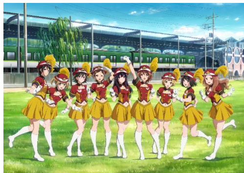
「京阪電車×響け！ユーフォニアム 2023」オリジナルイラスト ©武田綾乃・宝島社／『響け！』製作委員会

今年は、この夏上映の映画『特別編 響け！ユーフォニアム～アンサンブルコンテスト～』のメインキャラクターを中心に、京阪特急8000系をイメージしたオリジナルカラーのマーチング衣装で登場。ハットは乗務員の制帽をモチーフにし、胸には鳩マークのバッジもキラリ。細部にこだわったオリジナルイラストとなっています。