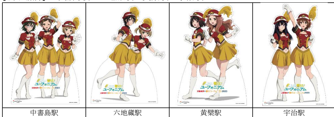
キャラクター等身大パネル(イメージ)