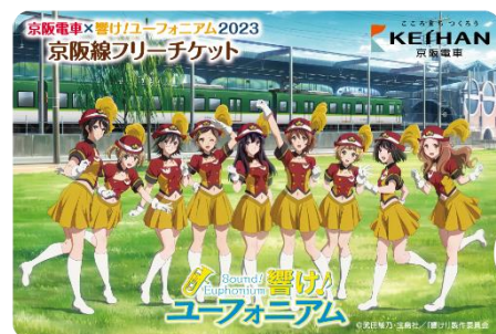
京阪電車×響け！ユーフォニアム 2023 京阪線フリーチケット(イメージ) ※オリジナルクリアファイル台紙付き