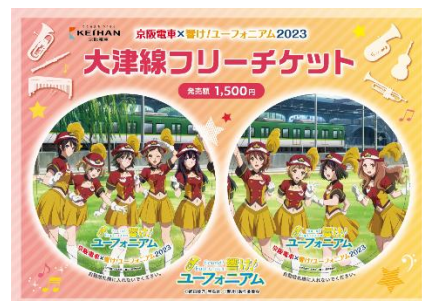
京阪電車×響け！ユーフォニアム 2023 大津線フリーチケット(イメージ)(9月発売分) ※オリジナルクリアファイル付き