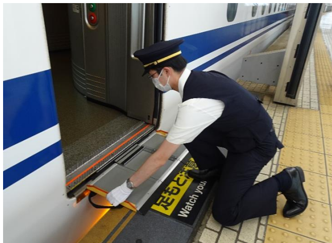
係員による渡り板の設置