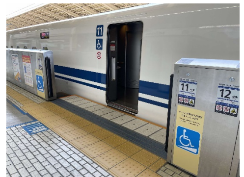
整備後のイメージ