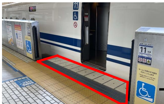
整備後のイメージ (赤枠が対策実施箇所)