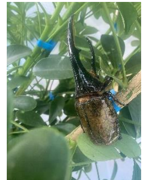
ケージ内のカブトムシ